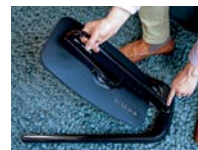
1er LEVIER DE VERROUILLAGE/ DÉVERROUILLAGE