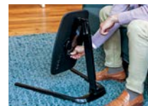
2ND LEVIER DE VERROUILLAGE/ DÉVERROUILLAGE