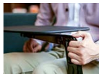
RÉGLAGE EN HAUTEUR