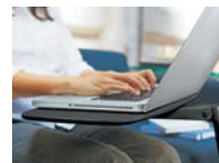
SURFACE DE TRAVAIL ROTATIVE