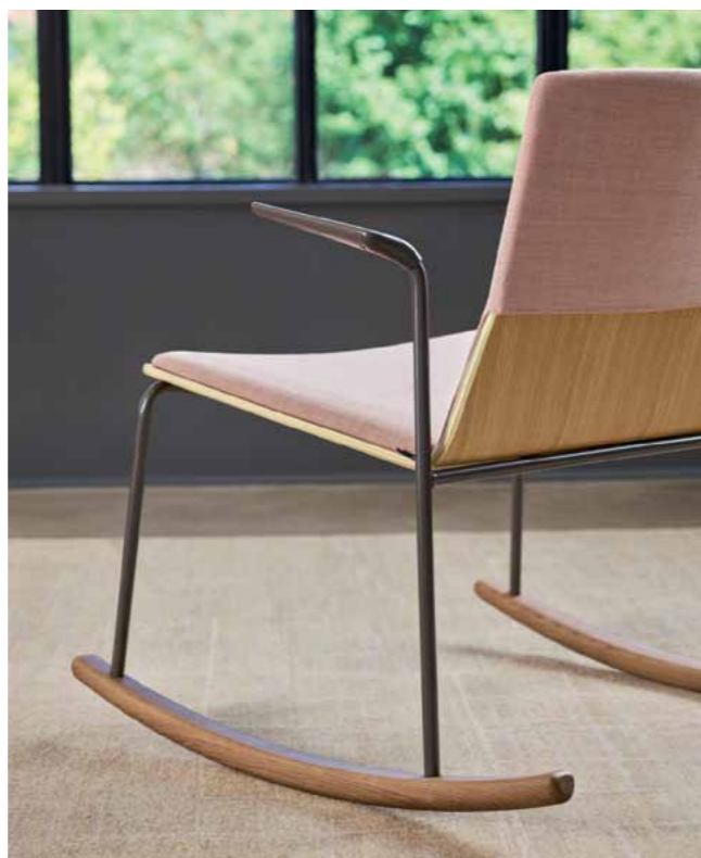
Le mouvement au cœur de l'assise. La forme moderne et raffinée de l'assise lounge Montara650 devient la base du nouveau rocking-chair.

Les réunions informelles peuvent être particulièrement productives. Mais trop souvent, le mobilier n'offre guère d'inspiration. Le Coalesse Design Group et le studio de design espagnol Lievore Altherr Molina ont su créer une alternative raffinée. Classique et informelle, la collection Montara650 est le reflet d'un savoir-faire moderne et d'un confort inné. Les lignes sculptées de ces sièges, tabourets, rocking-chairs et lounges s'allient à la simplicité des tables qui offrent une atmosphère café sur mesure aux espaces informels. Une solution pleine d'inspiration pour les collaborateurs mobiles d'aujourd'hui.