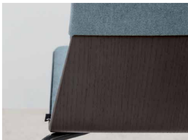
——— Détails tapisserie. Personnalisez vos sièges grâce à de multiples options allant des coques en bois aux coques entièrement tapissées.