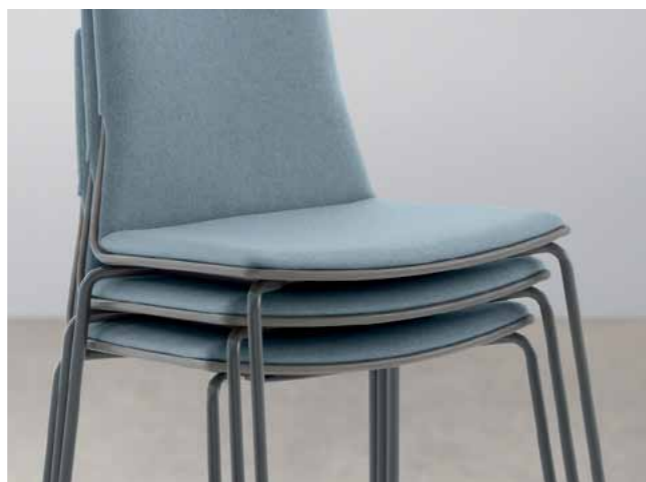
——— Sièges empilables. Les versions 4 pieds et luge sont empilables jusqu'à 6 sièges.

Le siège Montara650 est une réponse ingénieuse aux réunions improvisées. Le confort de la coque bois sculptée avec finition chêne peut être accentué par un revêtement complet ou un coussin d'assise. Par ses nuances chaudes et accueillantes, Montara650 comblera tout un chacun en apportant une touche de luxe à un prix abordable.