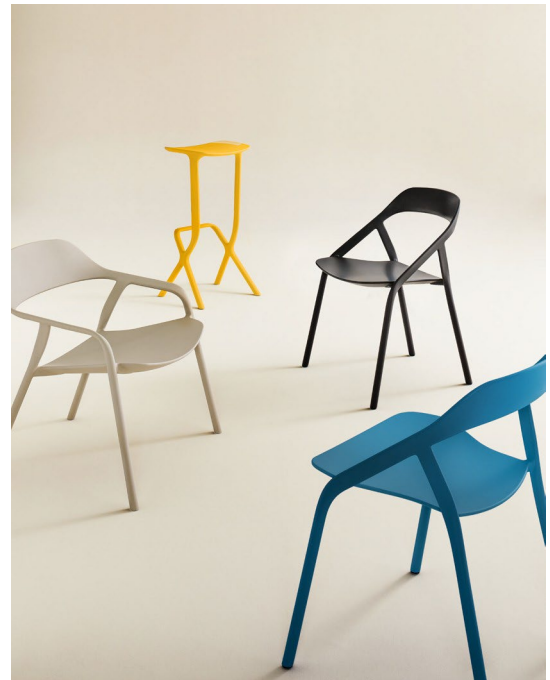
Des chaises, tabourets et sièges lounges emblématiques et esthétiques qui réinventent notre approche de l'artisanat moderne.

La collection LessThanFive revisite le siège sous un tout nouvel angle empreint de légèreté grâce à sa conception à base de fibre de carbone, à son étonnante légèreté, à sa solidité exceptionnelle, et à son poids inférieur à cinq livres. Des chaises, des tabourets et des sièges lounge qui incarnent la force du minimalisme.