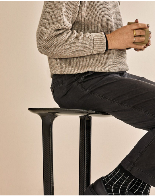
Assise minimale, stabilité maximale.

Incroyablement léger et étonnamment solide, il présente une assise en porte-faux équilibrée au-dessus d'un repose-pied en X, une prouesse que seule la fibre de carbone pouvait réaliser. Le tabouret qui en résulte soutient fermement le corps sans structure ni poids superflus. Parfait pour des réunions improvisées et des espaces intermédiaires, ce tabouret minimaliste offre une mobilité optimale sur le lieu de travail. Un exploit d'ingéniosité à la matérialité unique, une merveille de légèreté et d'équilibre.