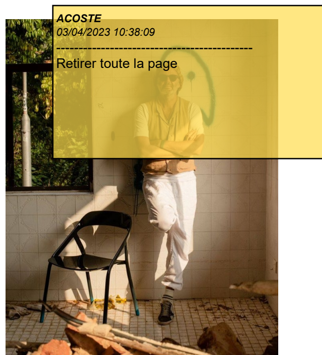
Michael Young et le Coalesse Design Group ont collaboré pour explorer une nouvelle forme (et un nouveau matériau), créant ainsi un résultat surprenant. Les tables MoreThanFive viennent superbement compléter et contrebalancer les sièges LessThanFive.

Une puissante union. Dans le prolongement de la gamme de sièges LessThanFive™, la table MoreThanFive™ intronise le fer forgé comme contrepoint de la fibre de carbone en une puissante union des extrêmes. Un matériau élémentaire rendu extraordinaire par l'artisanat moderne. Légèreté et densité redéfinies. Michael Young et le Coalesse Design Group ont collaboré pour explorer une nouvelle forme (et un nouveau matériau), créant ainsi un résultat surprenant.